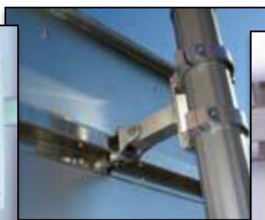
sur mâts alu ø76 ou ø90