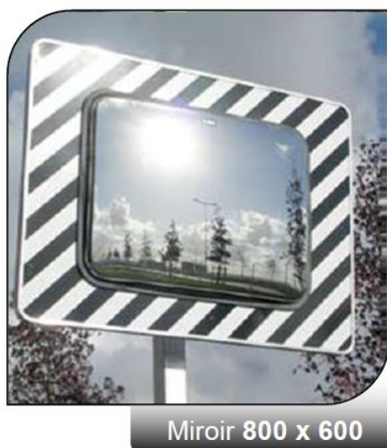
Miroir 800 x 600