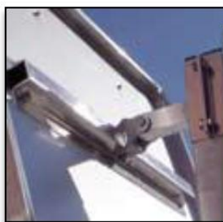
sur poteau acier 80x80