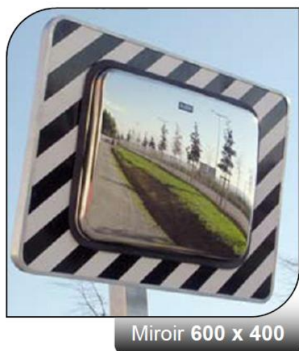
Miroir 600 x 400