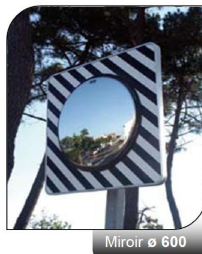
Miroir ø 600