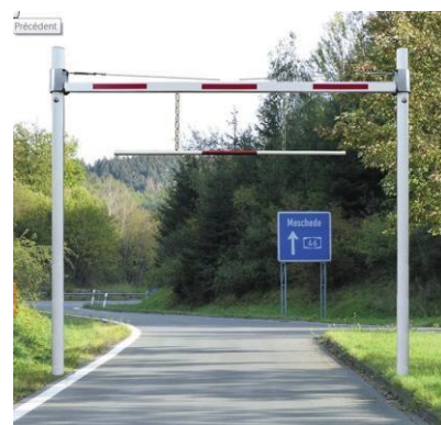
Modèle à sceller