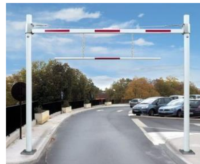
Modèle sur platines