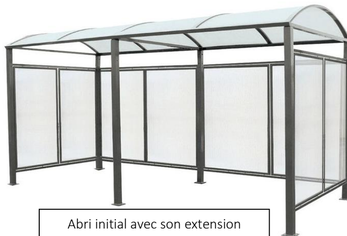
Abri initial avec son extension

Il est modulable grâce à des extensions pouvant créer de grands abris à l'infini, selon les besoins.