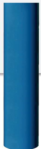
H 700 mm