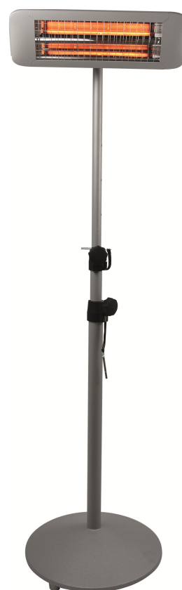
Modèle IP24 sur pied coloris titane