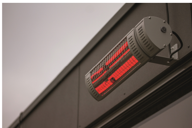
Modèle IP 65