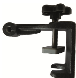
Fixation pour poteau jusqu'à 40 mm